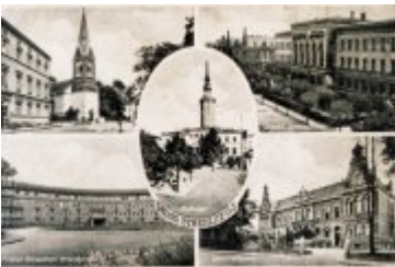
• Stare fotografie