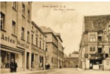
• Stare zdjęcia