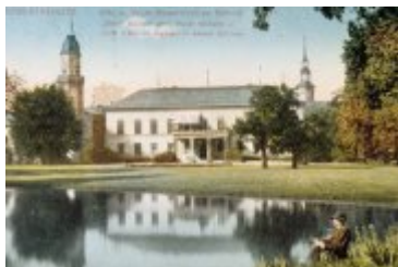
• Stare zdjęcia