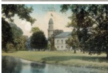
• Stare zdjęcia