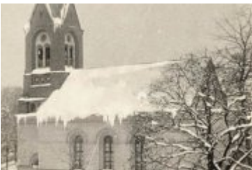
• Stare fotografie