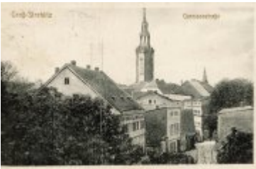
• Stare fotografie