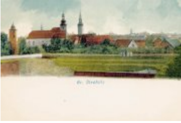
• Stare zdjęcia