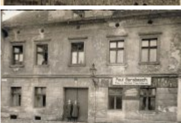
• Stare fotografie