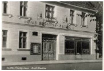
• Stare fotografie