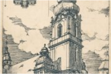
• Stare fotografie