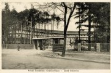
• Stare fotografie