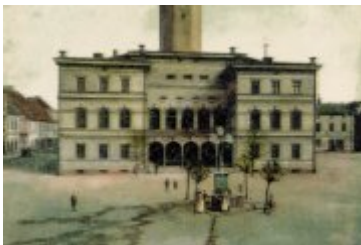
• Stare zdjęcia