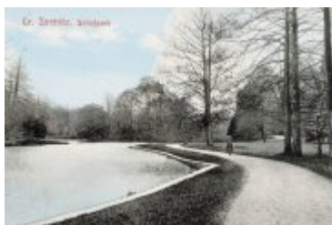
• Stare zdjęcia