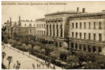
• Stare zdjęcia