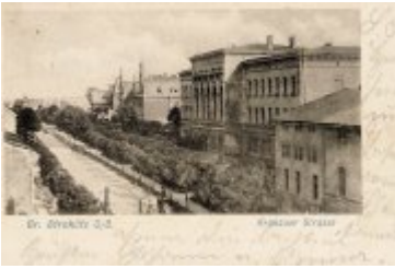
• Stare zdjęcia