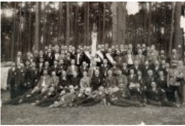
• Stare fotografie