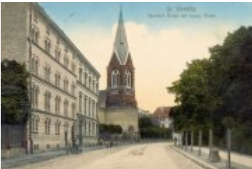
• Stare zdjęcia