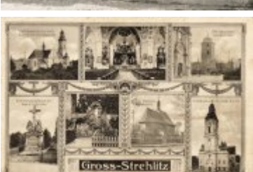
• Stare fotografie