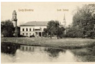
• Stare fotografie