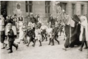
• Stare fotografie