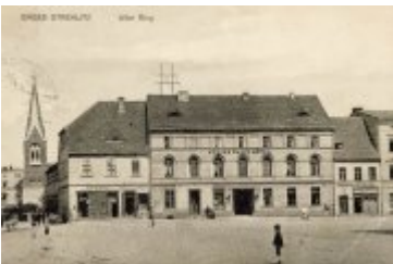
• Stare fotografie