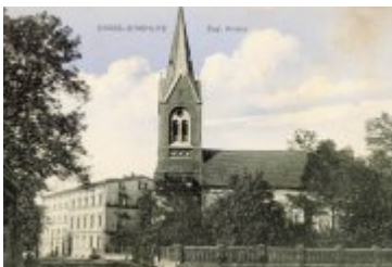
• Stare zdjęcia