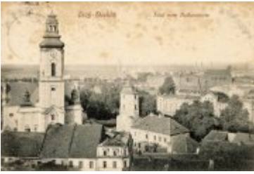
• Stare fotografie