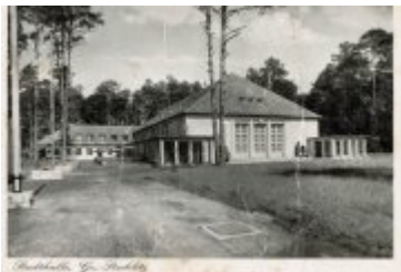
• Stare fotografie