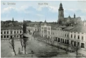
• Stare zdjęcia