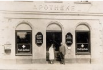
• Stare fotografie