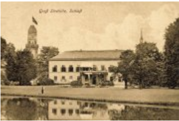
• Stare zdjęcia