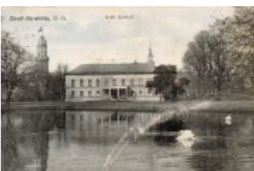
• Stare fotografie