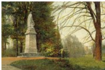
• Stare zdjęcia