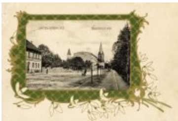
• Stare zdjęcia