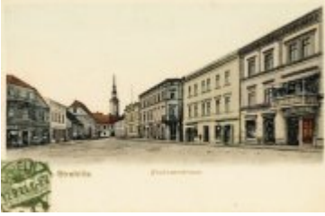
• Stare zdjęcia