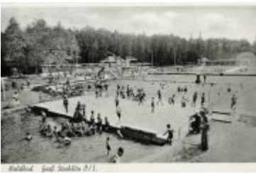
• Stare zdjęcia