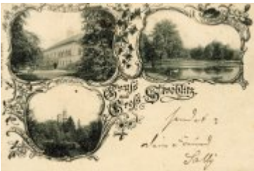
• Stare fotografie