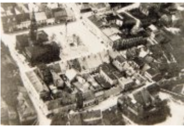
• Stare fotografie