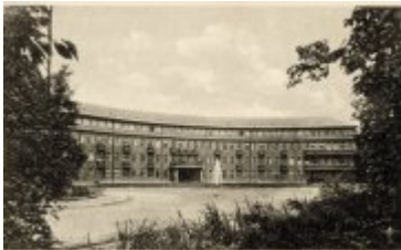
• Stare fotografie