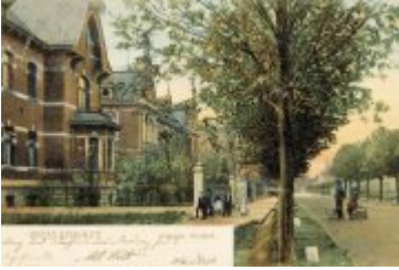
• Stare zdjęcia