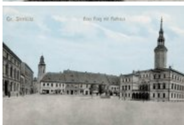
• Stare zdjęcia