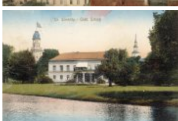
• Stare zdjęcia