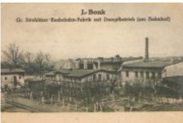
• Stare fotografie