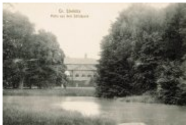
• Stare zdjęcia